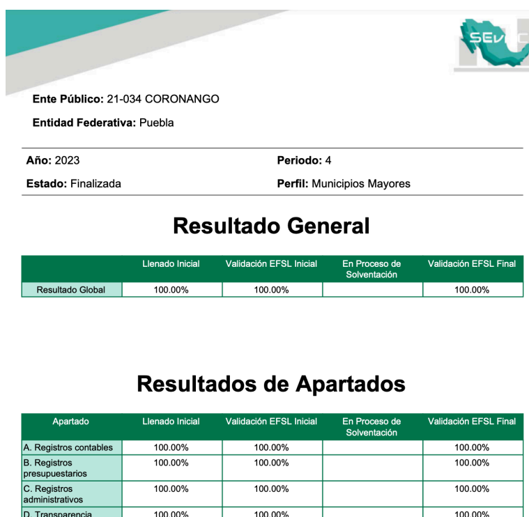
Imagen 2: Resultado final de la captura en SEvAC.

Adicional a ello muestra un cumplimiento de validación de 100% de la información reportada de manera trimestral con respecto a diversos temas de armonización contable, que tiene como propósito mostrar el grado de cumplimiento a la LGCG y lineamientos CONAC, mediante la plataforma del SEvAC, teniendo de manera individual los siguientes resultados;